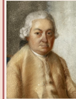
Carl Philipp Emanuel Bach (1714-1788)

Sonate in C, W. 136 andante - allegro moderato - allegretto