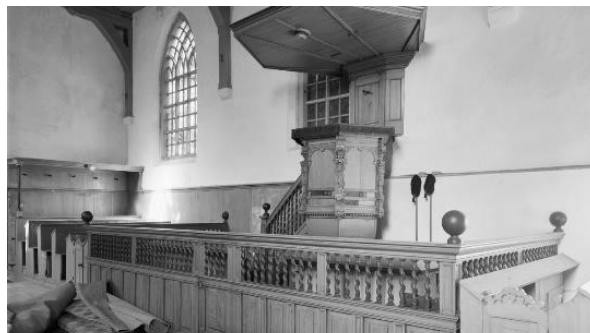
De preekstoel zoals die in Wijdenes stond...

Deze zomer kunt u een tentoonstelling tegemoet zien, waarin het hele verhaal verteld wordt en de vijf oorspronkelijke panelen ook te zien zullen zijn.