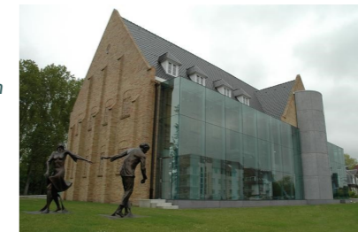
Abdijmuseum 'Ten Duinen' 1138'

Rond 14.45 uur kunt u deelnemen aan een rondleiding door de kerk en op 18 juli en 15 augustus nemen we u na de orgelbespeeling