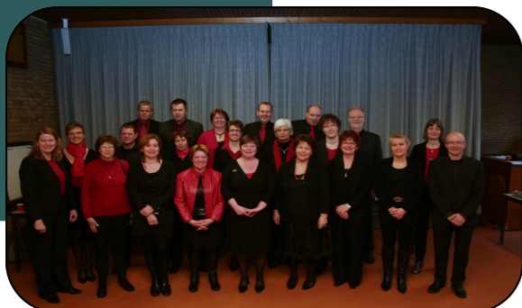
Koor 'Joy' uit Rotterdam

Als illustratie van het thema van het symposium wordt de cantate 'Fire of God, undying flame' van Alexander Prins uitgevoerd. Prins is een Westlandse musicus die in deze cantate bewust heeft geprobeerd kerkmuziek te schrijven die aansluit bij moderne,