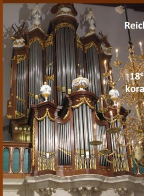
Reichner-Bätz orgel Abdijskerk Loosduinen

Van het Reichner-Bätz-Steendam orgel (1780/1856/2006) is een CD verkrijgbaar met 18e en 19e eeuwse koraalbewerkingen. Deze CD is geproduceerd door Orgelmakerij Steendam en te verkrijgen voor slechts 5 euro (achterin de kerk).