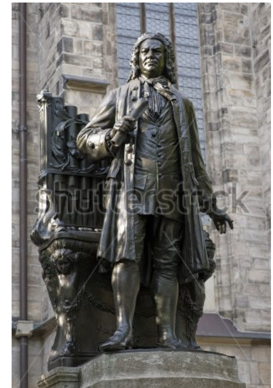
Standbeeld van Bach voor de St. Thomas kerk in Leipzig, Duitsland, waar hij 'Thomaskantor' was van 1723 tot zijn dood. Hij ligt ook in deze kerk begraven.

Het fuga-thema is misschien wel het best te omschrijven met de term 'stoer'. Van vier opeenvolgende tonen van gelijke lengte weet Bach een bouwwerk te maken dat (net als het Preludium) groots te noemen is.