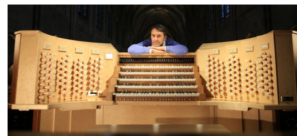
Olivier Latry op het orgel van de Notre-Dame in Parijs