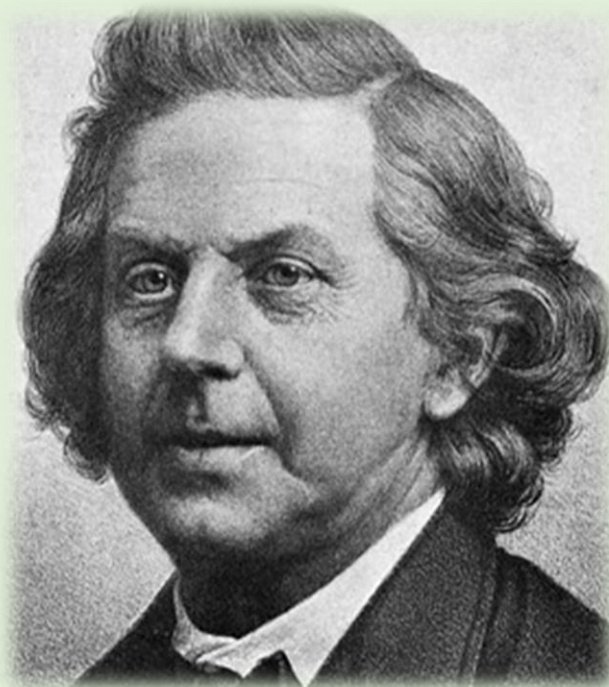
Niels W. Gade

De belangrijkste componist uit de 19e eeuw in Denemarken was Niels W. Gade , al was de waardering van Mendelssohn, die hij in 1847 opvolgde als dirigent van het Gewandhausorchester in Leipzig, nodig om de Denen daarvan te overtuigen. Hij schreef niet zo veel werken voor orgel maar zijn 'Tre Tonestykker' leveren een belangrijke bijdrage aan het 19e-eeuwse orgelrepertoire.